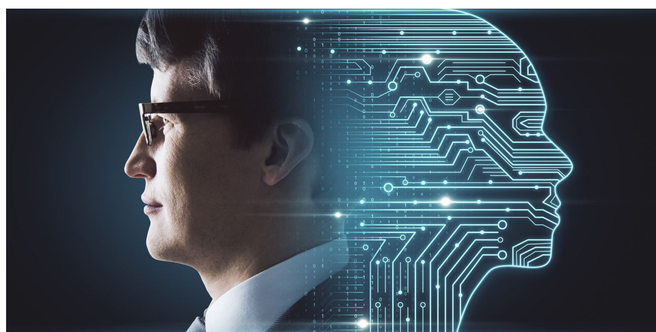
FIG. 2 - REALIDADE

Em um momento em que a economia brasileira enfrenta desafios significativos e busca novas fontes de inovação e crescimento, a compreensão dos criptoativos e seu impacto é mais crucial do que nunca. Este livro é uma contribuição para esse diálogo, fornecendo uma análise abrangente e fundamentada sobre o papel dos criptoativos na economia do Brasil. Ao longo das páginas que se seguem, convido o leitor a explorar esse fascinante e dinâmico universo, onde a tecnologia e as finanças se entrelaçam para moldar o futuro econômico do país.