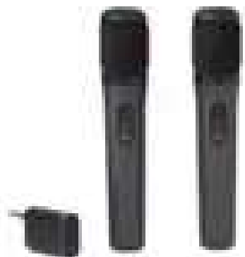
Microfones sem Fio JBL PartyBox 2x Re