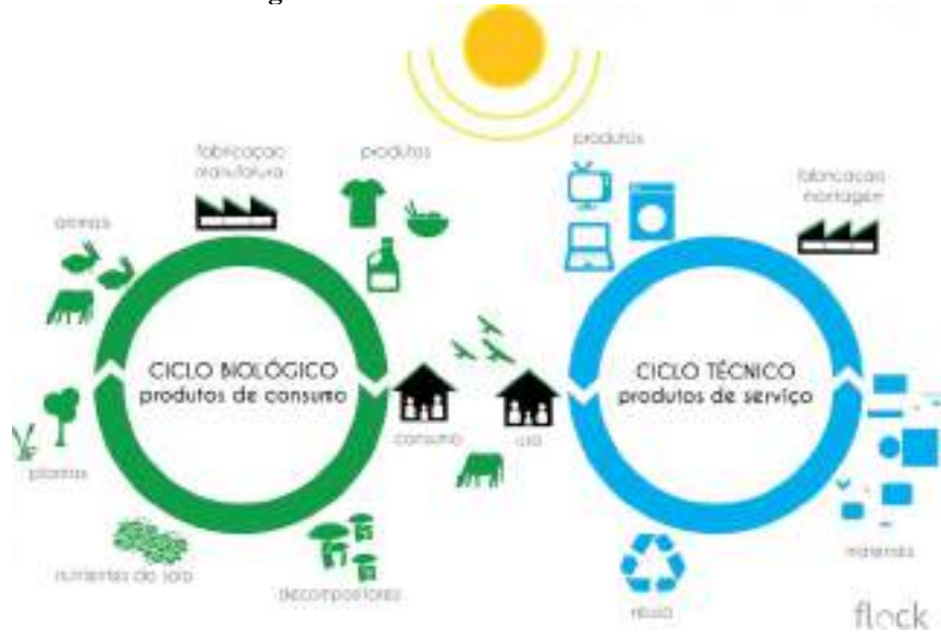
Figura 3. Ciclo cradle-to-cradle

O termo Economia Circular (EC) foi proposto pelo economista Walter Stahel durante a década de 80, com uma proposta em que os resíduos pudessem se tornar recursos pois percebeu que o prolongamento da vida útil de um produto se daria por meio da recuperação e reutilização (STAHHEL, 1981). Cradle-to-Cradle ou sistema do berço ao berço, cuja proposta seria reduzir a utilização mantendo o consumo de recursos (STAHHEL, GIARINI, 1989).