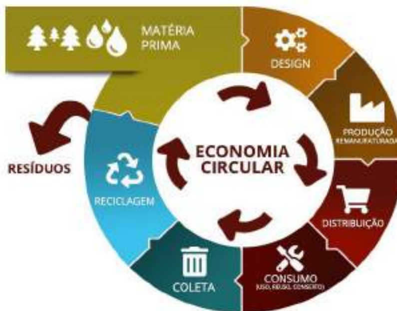
Figura 4. Economia Circular