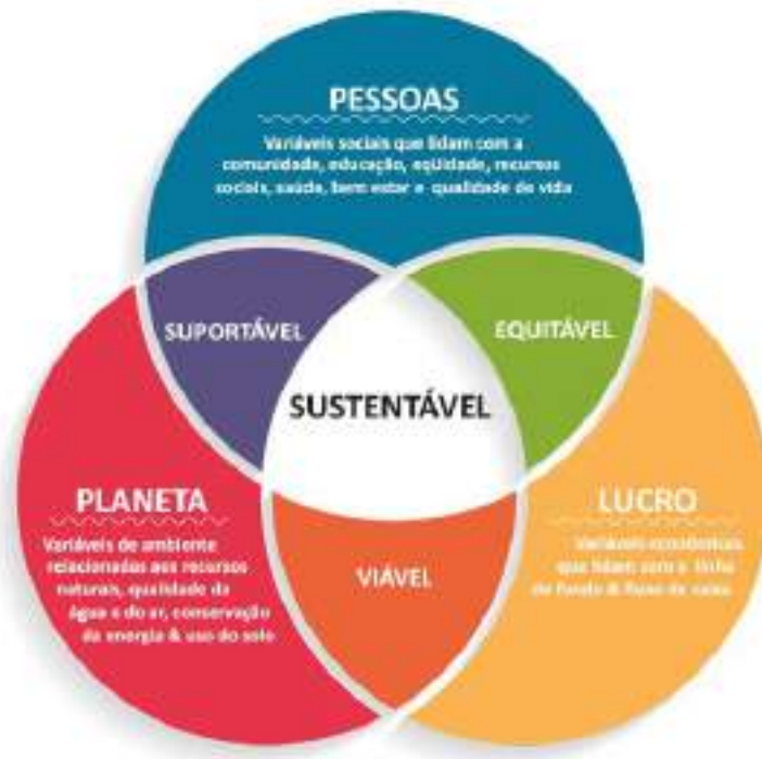
Figura 1. Tripple Bottom Line proposto por Elkington

Dessa forma, o Tripple Bottom Line, assegurado por ações sustentáveis, é o novo paradigma do século 21, de forma que garanta o desenvolvimento sustentável proposto por líderes pelo mundo (ELKINGTON, 2012), conforme mostra a figura a seguir: