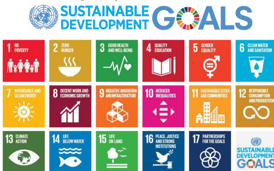
Figura 2. Objetivos de desenvolvimento sustentável

O processo, englobando 193 Estados Membros da ONU, resultou em um plano de ação universal composto por quatro partes: a Declaração, contendo a visão princípios e compromissos da Agenda; os Objetivos do Desenvolvimento Sustentável (ODS), propondo dezessete objetivos e 179 metas de ação global; o Acompanhamento e Avaliação da Agenda 2030, pautado em indicadores de monitoramentos das ações; e a Implementação, que trata dos meios fundamentais para a execução dos planos de ação (ODS BRASIL, 2022) conforme ilustra a figura a seguir: